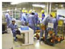
工具を作業現場に持って行く