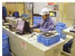
工具貸出センター