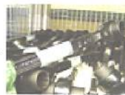
棚の中の工具(レンチ)