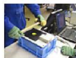
工具のICタグをリーダーライタで読み込む