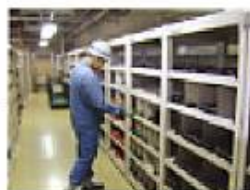
棚から工具を取り出す